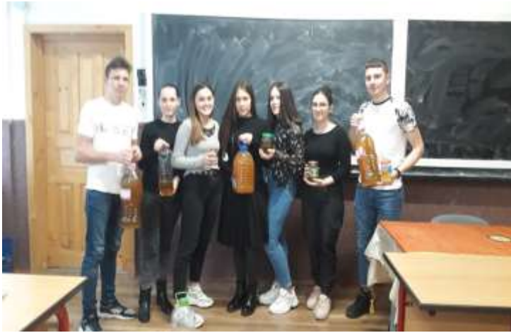
Activități colectare ulei uzat