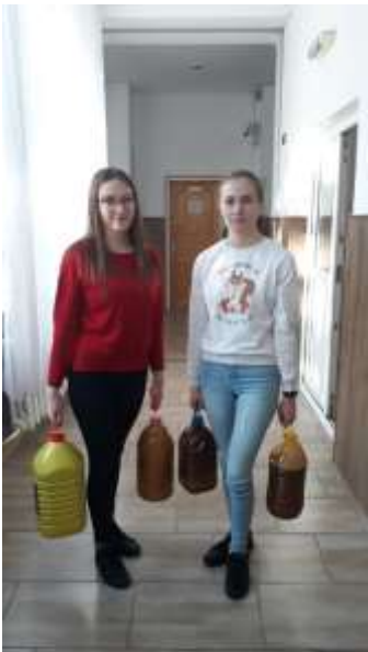
NOI SUNTEM „CAMPIOANE” LA COLECTAREA ULEIULUI UZAT!